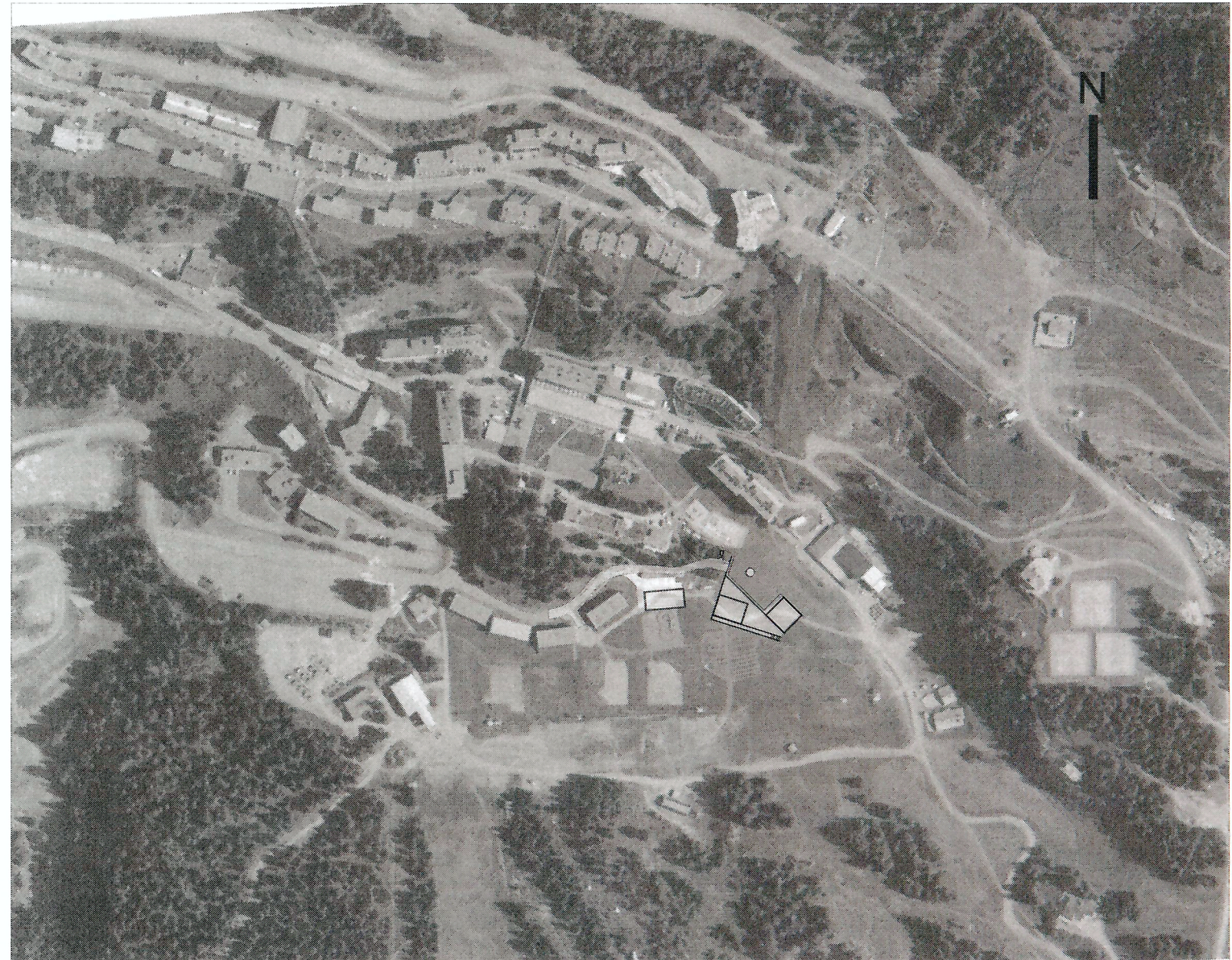
VUE AERIEUNE / échelle : 1/5000e